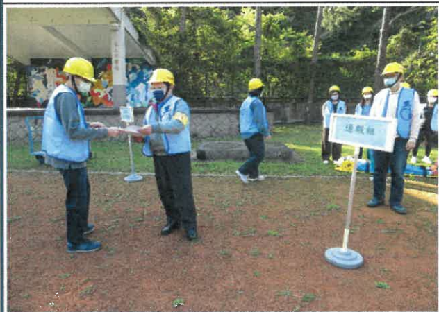
通班組彙整人數報告總指揮官