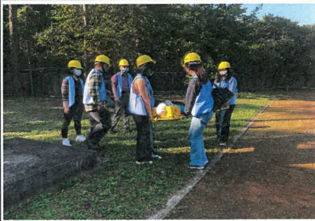
搶救暨救護組處理受傷學生