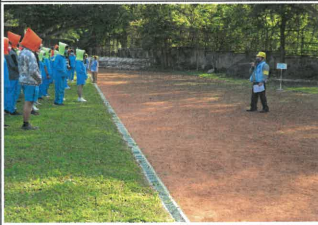
總指揮官講評演練過程