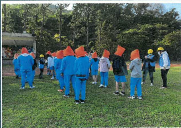
集合後，通報組確實清點各班人數